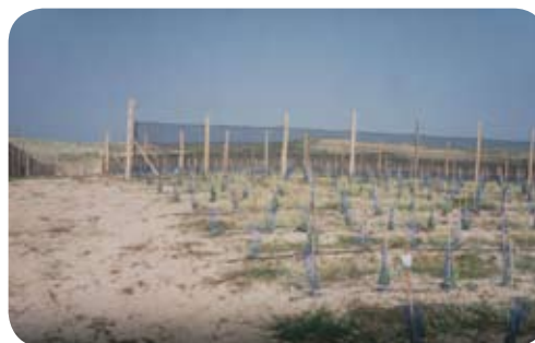
Vin des Sables

Des palissades de bruyères, brandes et genêts protégeaient la végétation ; la proximité immédiate de l'océan permettait aux plantations d'échapper aux fréquentes gelées printanières et d'accumuler, sur le sable brûlant, la chaleur de l'été ; on obtenait une maturité parfaite des raisins et une grande qualité de vin tout en maintenant vigueur et fertilité de la vigne.