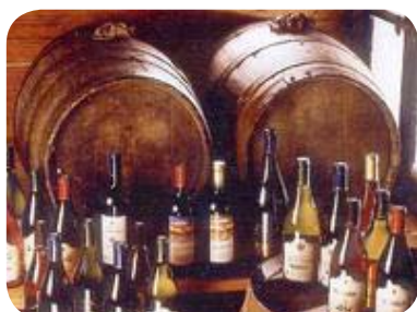
Vin de Tursan

L'un des plus connus est sans doute le Tursan, un VDQS qui existe en rouge, rosé et blanc. A l'époque gallo-romaine, il figurait parmi les vins admis à la table des Empereurs ; les abbayes de Pimbo, Saint Loubouer, Saint-Sever ou Vielle-Tursan ont largement contribué au développement de la vigne.